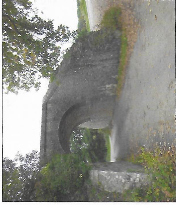
Le pont de l'ancienne voie ferroviaire dans le quartier du Lembarnes.

Ce samedi 16 janvier à 17h30 la messe sera célébrée à l'église de Lussan. Les santons des Rois Mages seront ajoutés à la jolie crèche de l'église. Le port du masque est obligatoire.